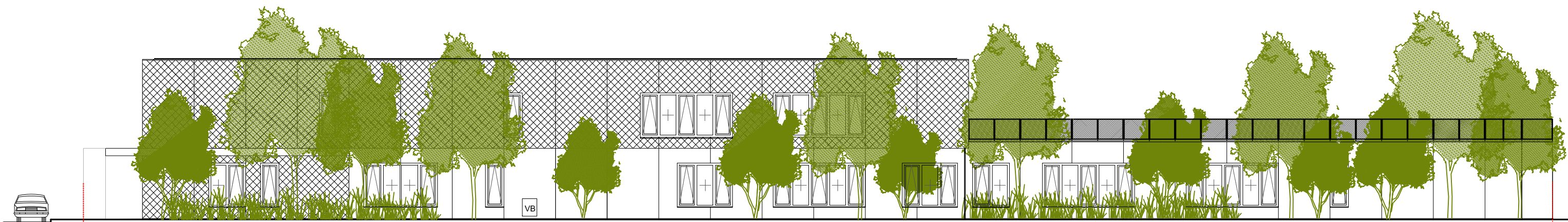
ELEVATION NORD - ECH: 1/200