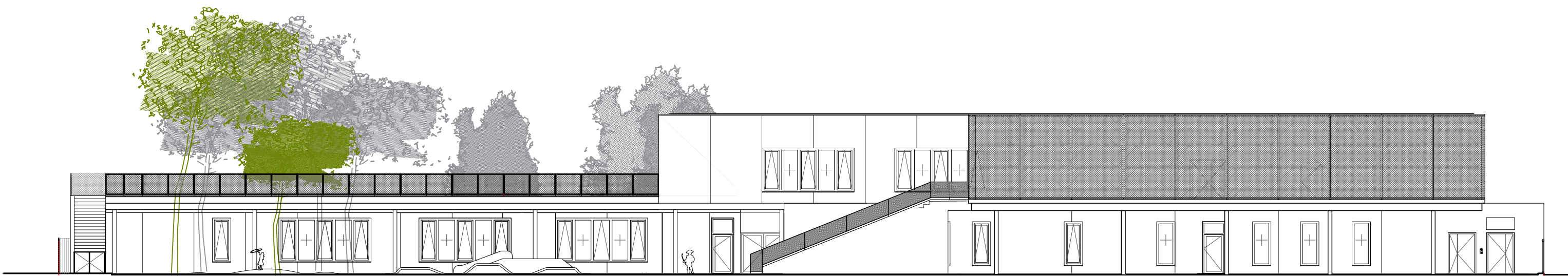
ELEVATION SUD - ECH: 1/200